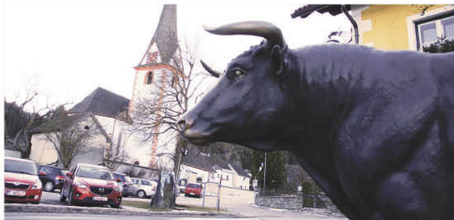
Das Dorf „St. Margarethen“, der UNESCO Biosphärenpark Salzburger Lungau sowie die Verkehrsplanung werden thematisiert.

Wie kann Mobilität im peripheren Raum gestaltet werden? Dieses Thema wird dann am 9. Juni, um 19:30 Uhr, in der Volksschule St. Margarethen behandelt: die Frage an diesem Nachhaltigkeits-Abend lautet nämlich „Verkehr planen – aber wie?“