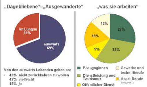
Ergebnisse der Befragung der letzten 20 Maturjahrgänge im Lungau gesamt 303 Befragte

MaturantInnen, die im Lungau bleiben wollen, passen ihren weiterführende Ausbildung an die Beschäftigungsmöglichkeiten im Lungau an - pädagogische Akademien, Sozialwesen, Gesundheit